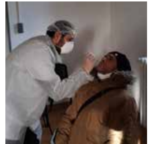
Test antigénique sur l'ESAT de Narbonne

Ainsi, début janvier, au retour des vacances de fin d'année a eu lieu le lancement des tests antigéniques dans les établissements et services de l'AFDAIM-ADAPEI 11.