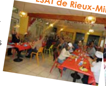
ESAT de Rieux-Minervois

Ces moments chaleureux ont été appréciés de tous.