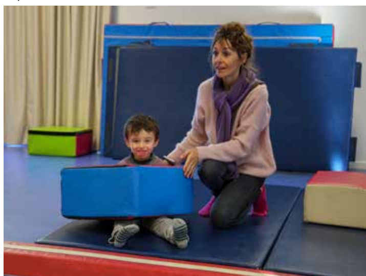
7 enfants sont accueillis dans l'UEMA de Bages

L'inauguration de cette unité a eu lieu le 3 décembre et a été organisée par l'Education Nationale en présence du représentant de l'ARS, du Député de la 2ème circonscription, de la Maire de Bages, du Président Adjoint de l'AFDAIM-ADAPEI 11, de la Directrice académique et de la Vice Présidente du Conseil départemental de l'Aude.