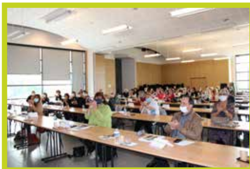
Gestes barrières et port du masque pour cette assemblée générale 2020