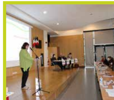
Intervention de Mireille ROBERT, Députée