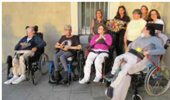
Les résidents de la MAS de Pennautier

L'artiste avait programmé dans le département de l'Aude quelques concerts très intimistes avec très peu de public à la réouverture des lieux culturels. Elle avait choisi d'inviter des publics "oubliés" qui n'ont pas forcément accès à la culture, aux concerts.